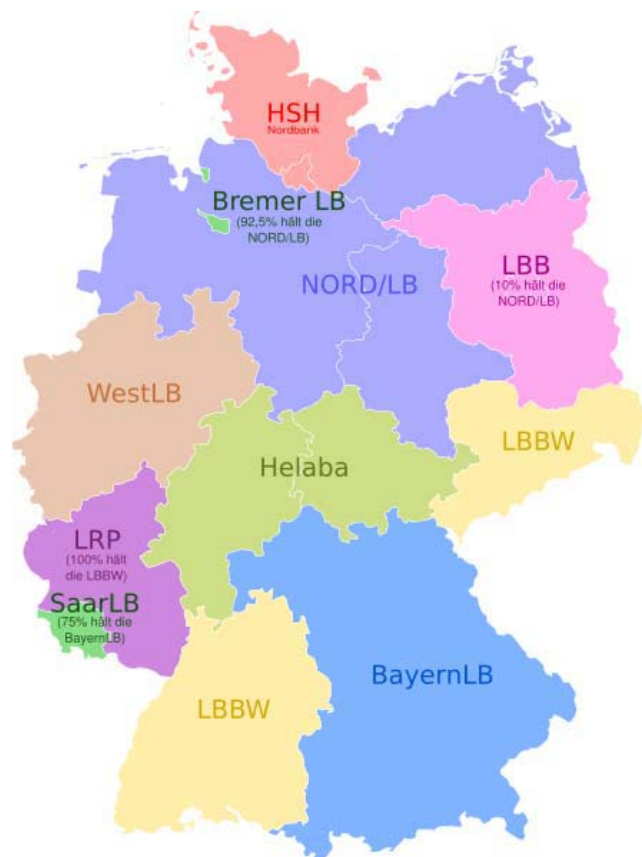
Grafik 1: Landesbanken in Deutschland

Die Landesbanken sind meistens gemeinsames Eigentum der jeweiligen Bundesländer und der regionalen Sparkassenverbände, dabei gibt es aber regionale Unterschiede. So haben die Länder Rheinland-Pfalz, Mecklenburg-Vorpommern, Sachsen, Brandenburg und Berlin inzwischen keinerlei Anteil an einer Landesbank mehr. Berlin stellt eine besondere